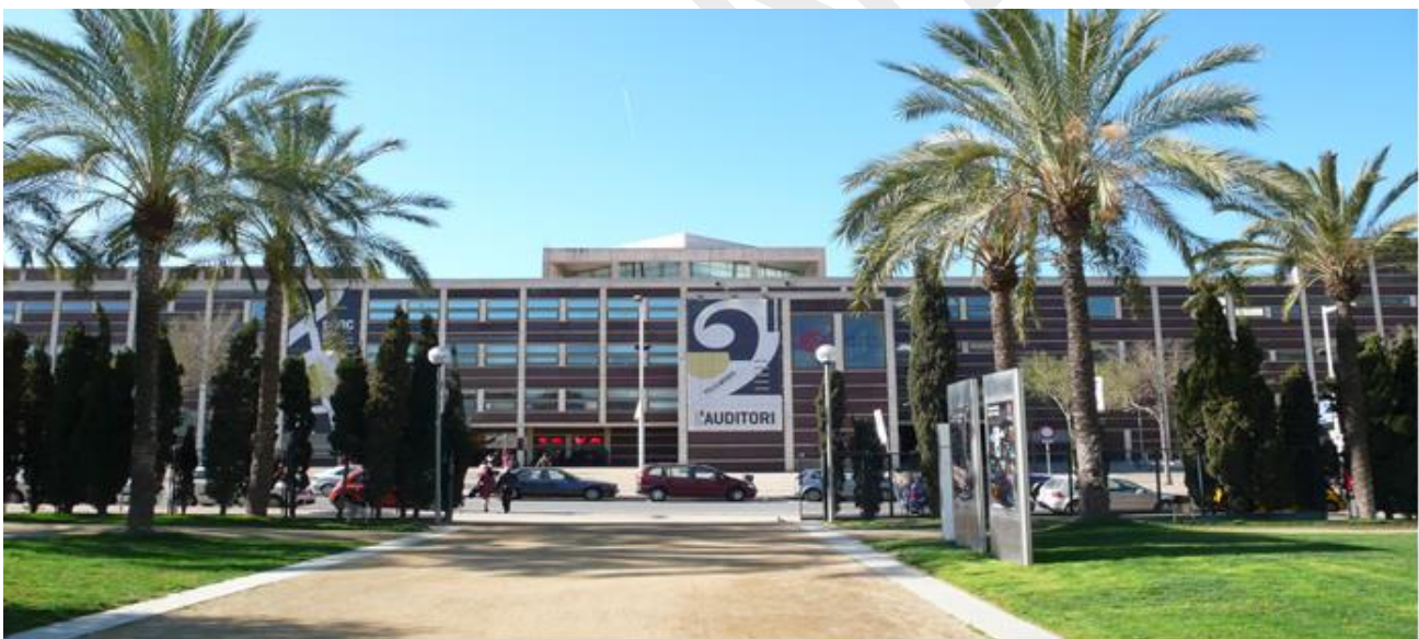
The Auditori, one of the main WSCM11 Venues

申し込み方法の詳細、募集要項、申し込みフォームはこちら: www.ifcm.net