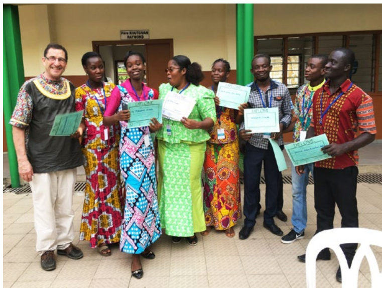
Abidjan, Côte d'Ivoire

tthiebaut@choralies.org — http://ifcm.net/cwb-2/