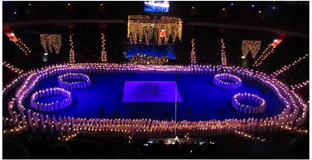
1400 Singers from Adolf Fredriks Music Classes and the Stockholms Musikgymnasium during a Lucia concert celebrated together with the World Choral Day

第12回世界合唱シンポジウム(WSCM2020) キア・オラ・コウトウ(みなさん、こんにちは) ニュージーランド・アオテアロアからご挨拶