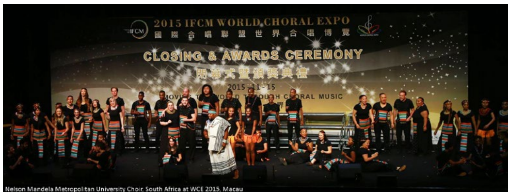
Nelson Mandela Metropolitan University Choir, South Africa at WCE 2015, Macau

参加の条件、申し込み要項については、こちらをごらんください。 World Choral EXPO 2019 最新情報はこちらでフォローできます。 World Choral EXPO Facebook page 2015年世界合唱博覧会、閉会式ハイライトのビデオ( video )もお楽しみください。