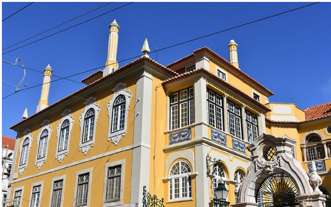
New head office of IFCM, Palacete dos Condes de Monte Real, Lisbon

今回の総会において、IFCMの新たな定款と法人設立認可証、新たな方針書が全会一致で可決されたことを、ここにご報告いたします。これら文書の改訂版はすべて、各リンクをクリックすることで、ごらんいただけます。