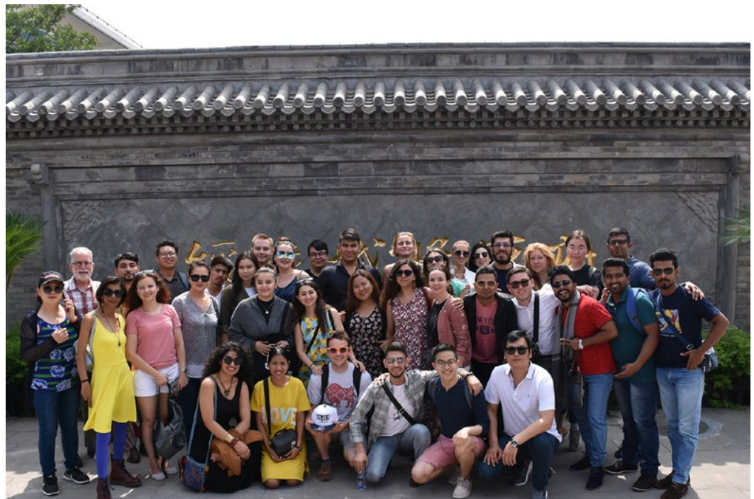
SCO Countries Youth Choir Singers visiting the ancient residence of generals

それぞれ異なる方式にさらされてきました。ロシア語圏のいくつかの国には、力強いけれども、融通が利かない／厳格すぎるとも言える合唱の伝統があります。そういった国々の歌手たちは、合唱における即興演奏というものを知らず、経験したこともありませんでした。彼らは自分の声と体や演奏空間の新たな使い方を学んだのです。また、独唱に関してすばらしい伝統のある東南アジアの歌手たちは、合唱団で歌ったことがありませんでした。彼らは譜面の読み方、仲間に合わせハーモニーのなかで歌う方法、統一のとれた／バランスのよいピッチ、和音、和声、音色を作るために自らの声を周囲に溶け込ませる方法を学びました。