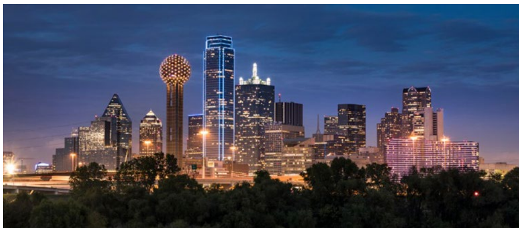
ACDA National Conference 2021 (Dallas, Texas, USA)