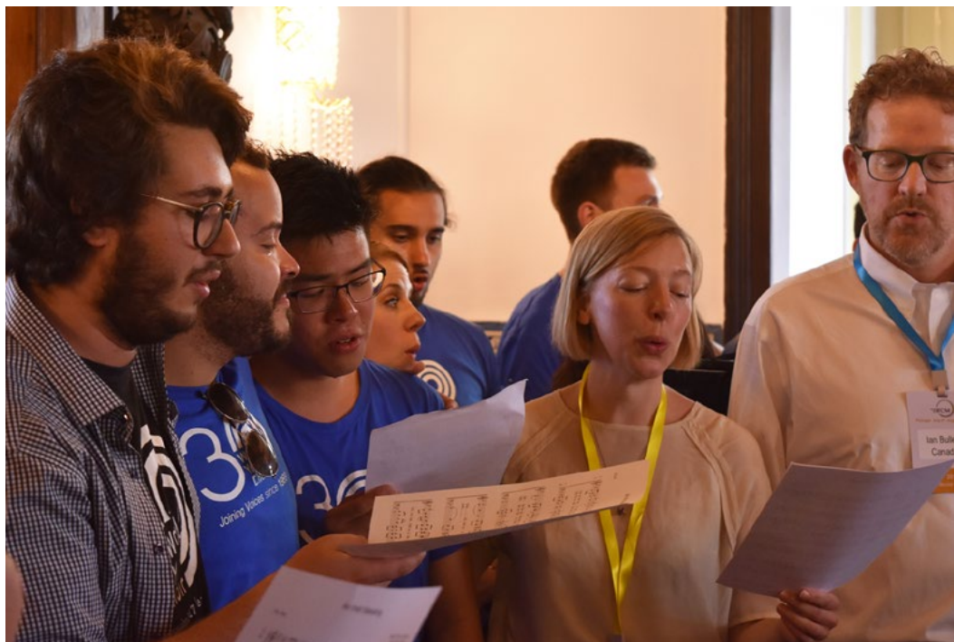
WYC 2019 singers and alumni singing 'Irish Blessing' at the Palacete dos Condes de Monte Real. IFCM new home

オーディションの詳細は、世界青少年合唱団のウェブサイト( WYC website )でご確認ください。